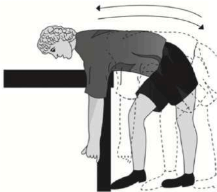
Figura 2. Representación gráfica de los movimientos pendulares de Codman. Flexión y extensión